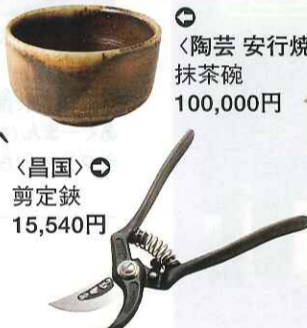
〈陶芸 安行焼〉 抹茶碗 100,000円 昌国 剪定鋏 15,540円