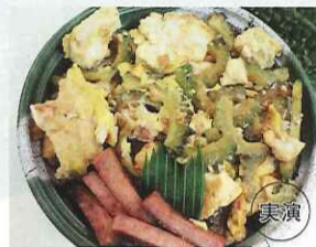
〈うちなー天ぷら はなはな〉 ゴーヤ井(1折)……………735円