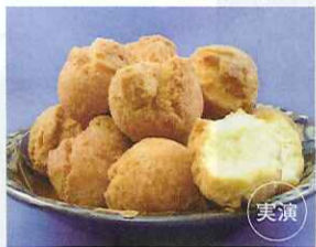
〈琉球菓子処 琉宮〉 サーターアンダギー (プレーン、1個)……………105円