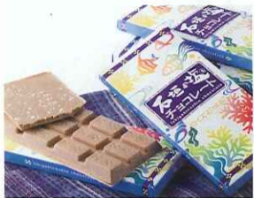
〈ロイズ石垣島〉 石垣の塩チョコレート (1箱、3枚入)……………735円