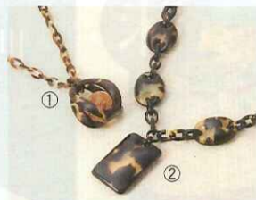
〈琉球総合剥製〉①べっ甲琥珀丸 玉入ネックレス(限定10点)12,600円 ②べっ甲水目付ネックレス63,000円