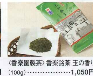
〈香楽園製茶〉香楽銘茶 玉の香り (100g)……………1,050円