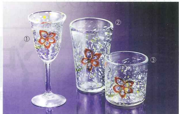
〈沖縄工芸村〉①ワイングラス……………5,250円 ②ピアグラス……………4,410円/③ロックグラス……………4,200円