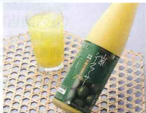
〈又吉葉草園〉 山原シークワサー(500ml) ……………2,625円