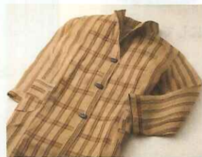
〈おしゃれ工房やぎ〉 琉球芭蕉布ロングジャケット (麻100%)……………315,000円