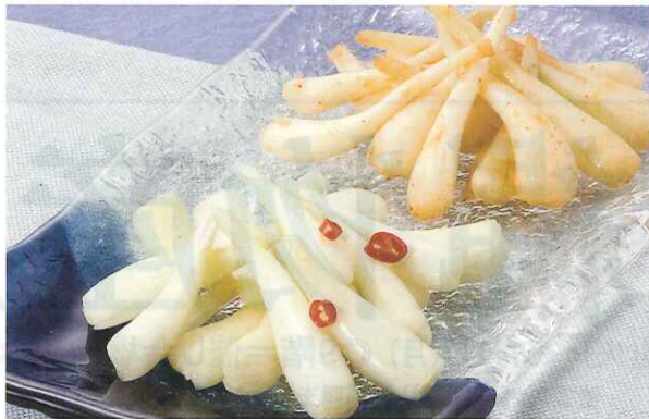
〈フィフティ・プランニング〉 島らっきょう(塩漬・キムチ漬、130g)……………各1,050円