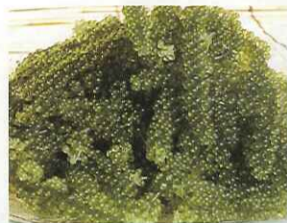
〈琉球特産販売 ちゅら島市場〉 沖縄県産 海ぶどう(45g) 630円 沖縄県産 生もずく(150g) 378円