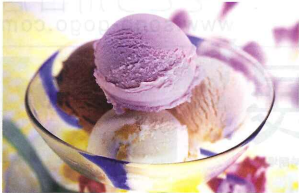
〈ブルーシール〉 さとうぎアイスほか 各種……………各301円