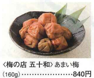
〈梅の店 五十和〉あまい梅 (160g)……………840円