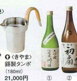
〈きやま〉 錫製タンポ (180ml) 21,000円 川口初扇(720ml) 850円