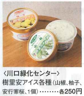
〈川口緑化センター〉 樹里安アイス各種(山椒、柚子、 安行寒桜、1個)……………各250円