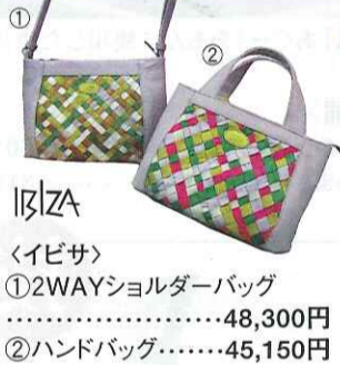
IBIZA 〈イピサ〉 ①2WAYショルダーバッグ ……………48,300円 ②ハンドバッグ……………45,150円