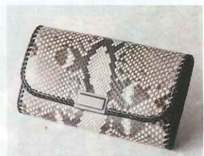
〈パイソン〉 錦へビ 女性用財布(かぶせ) ……………33,600円