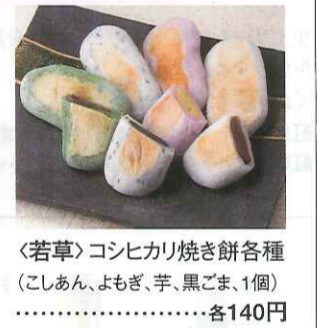
〈若草〉コシヒカリ焼き餅各種 (こしあん、よもぎ、芋、黒ごま、1個) ……………各140円