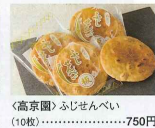
〈高京園〉ふじせんべい (10枚)……………750円