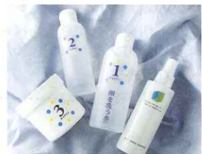
〈カミヤマ美研販売〉 チュラサン化粧水(顔を洗う水、 250ml)……………3,465円