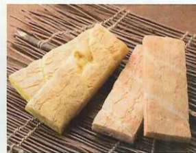
〈麩久寿〉 黄金麩(2本入)……………525円 麩ののべ棒(3枚入)……………525円