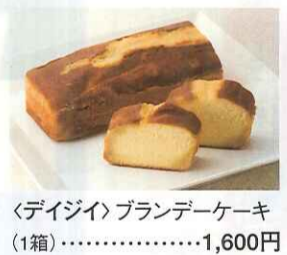
〈デイジイ〉ブランデーケーキ (1箱)……………1,600円