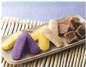
〈健康市場〉 ちんすこう(2個入×18袋、黒糖・ 紅芋、ほか)……………各630円