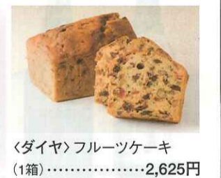
〈ダイヤ〉フルーツケーキ (1箱)……………2,625円