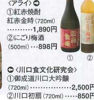
〈アライ〉 ①紅赤焼酎 紅赤金時(720ml) ……………1,890円 ②にごり梅酒 (500ml)……………898円 川口食文化研究会 ①御成道川口大吟醸 (720ml)……………2,500円 ②川口初扇(720ml)……………850円