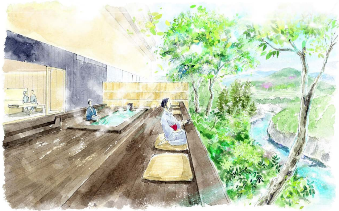
溪流の音や風を五感で感じるテラス（イメージ図）